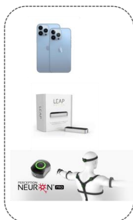
モーションキャプチャー