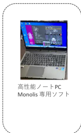
高性能ノートPC Monolis 専用ソフト